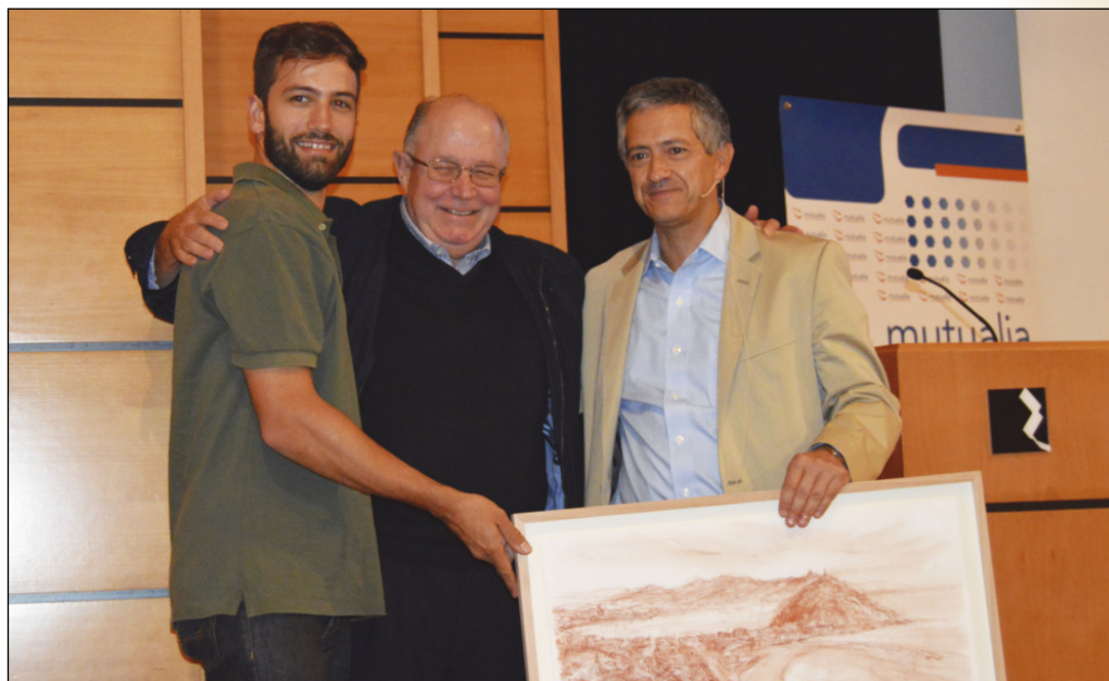
Entrega de premios IX Curso de Ecografía Musculoesquelética (2017).