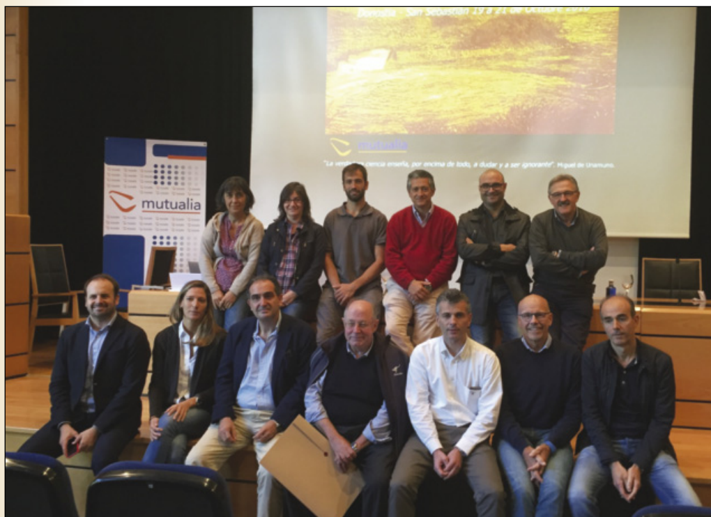
Profesorado del VIII Curso de Ecografía Musculoesquelética (2016).