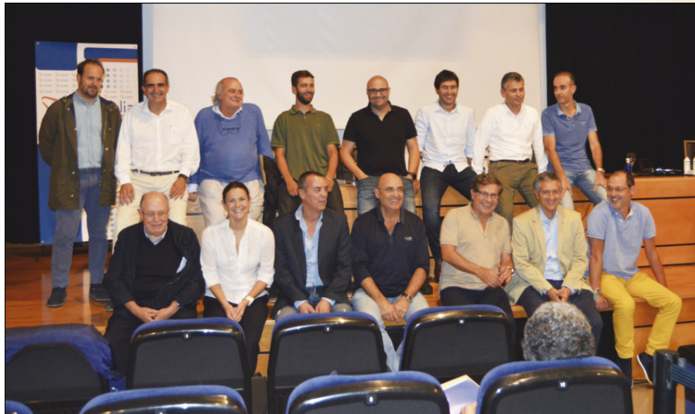
Profesorado del IX Curso de Ecografía Musculoesquelética (2017).